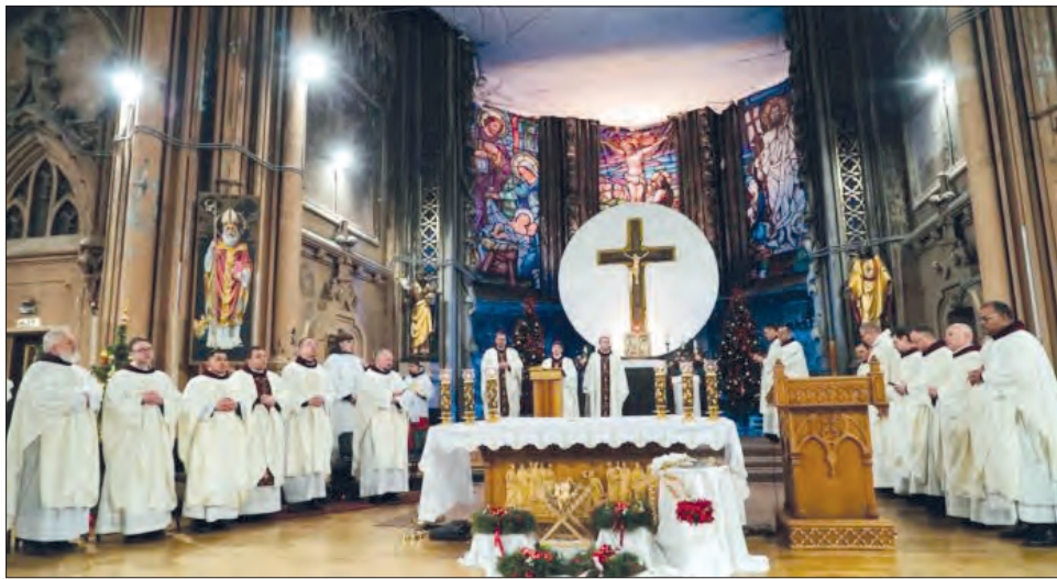
Lepiej późno niż wcale – piękny neogotycki kościół św. Mikołaja w Kijowie, wybudowany na początku XX wieku ze zbiorów kijowskich Polaków, po 35 latach starań zwrócono w końcu miejscowej parafii rzymskokatolickiej.